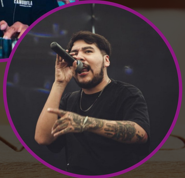
ARLO MX @arlomx